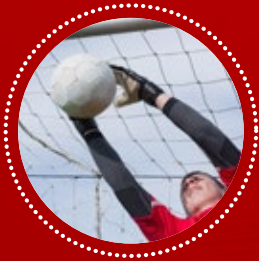
GOALKEEPER ARQUERO / PORTERO