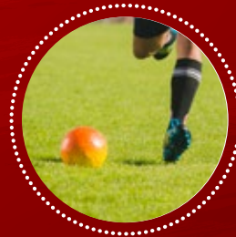
PENALTY KICK TIRO PENAL