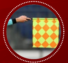
OFFSIDE POSICIÓN ADELANTADA